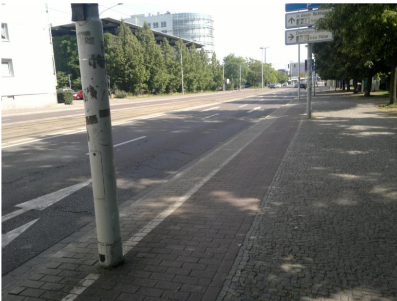
Fehlende Mindestbreiten – Masten im Radweg