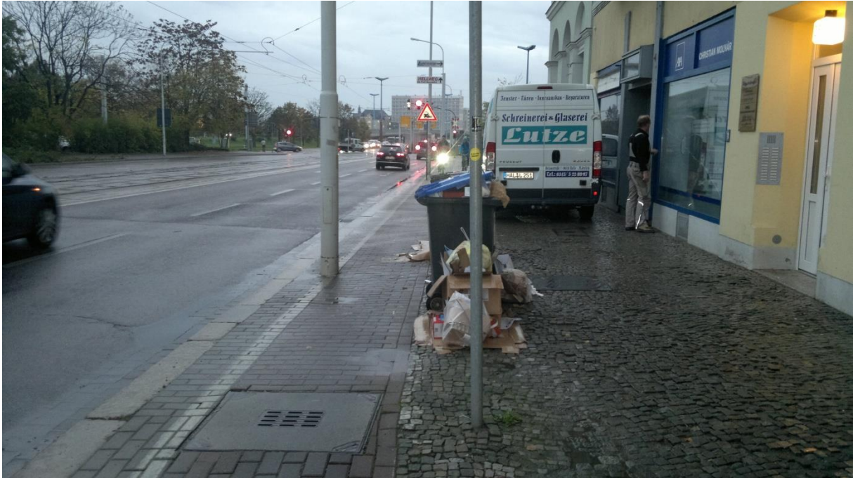
Fehlende Mindestbreite – Hindernisse im Sicherheitsraum