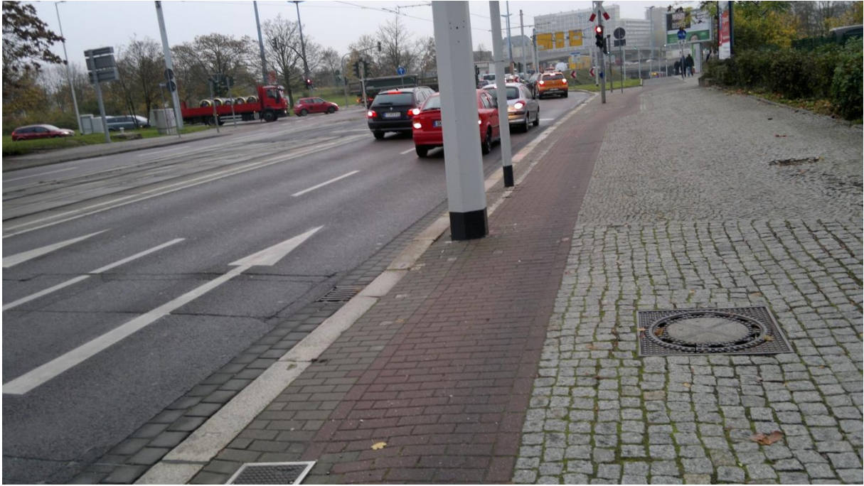
Fehlende Mindestbreiten – Masten im Radweg