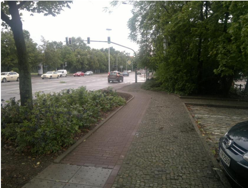
Fehlende Mindestbreiten, enger Kurvenradius